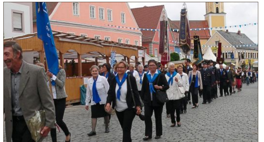
Am Sonntag führte der Kirchenzug diesmal zur Bühne vor dem Rathaus.