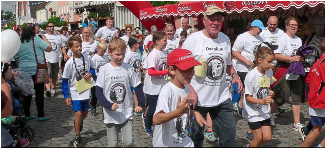
Viele nahmen am Sponsorenlauf des Fördervereins der Langquaid Schulen teil. Dieser fand diesmal unter dem Motto „Oxen Run“ statt.