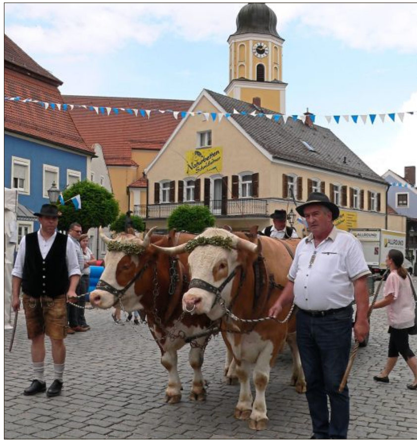
Das Ochsespann drehte seine Runden durch den Markt.

Am Abend gab es auf zwei Bühnen stimmungsvolle Live-Musik – eine bunte Mischung aus bayerischer und Welt-Musik. Evergreens mit Backbeat und Pop und Rock mit den Rock@Rollers heizten allen Musikgeschmäckern ein. Das Netzwerk