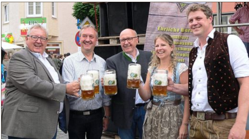
Die Prominenz stieß auf das Gelingen des Festes an.