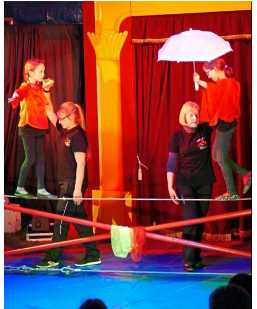
Beeindruckender Balanceakt auf dem Seil.