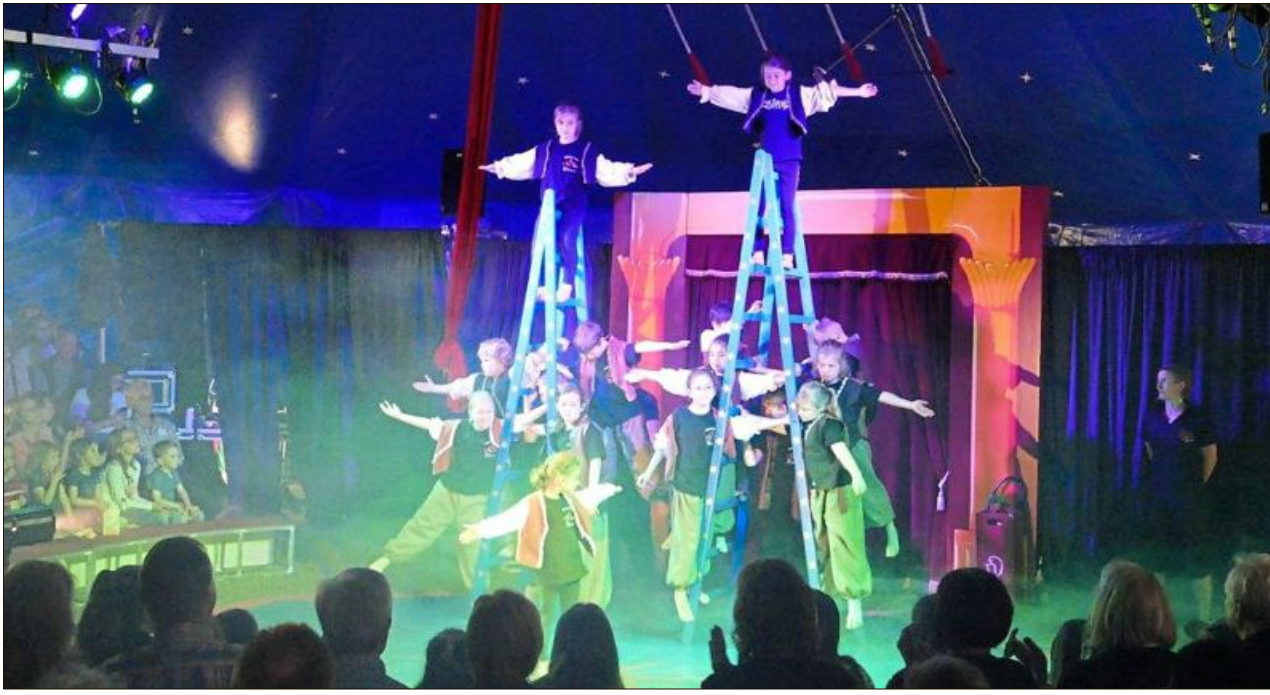
Artistik pur boten die Schüler beim Zirkus „ZappZarapp“ dem staunenden Publikum.