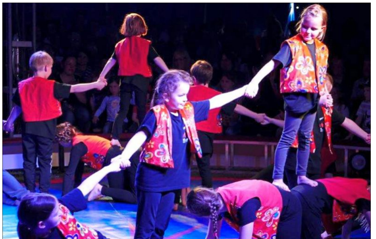
Formvollendete Akrobatik stand auf dem Programm.