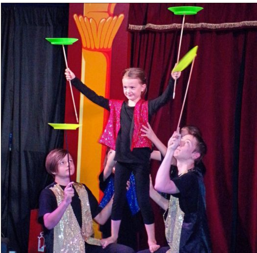
Jonglieren mit den Tellern.