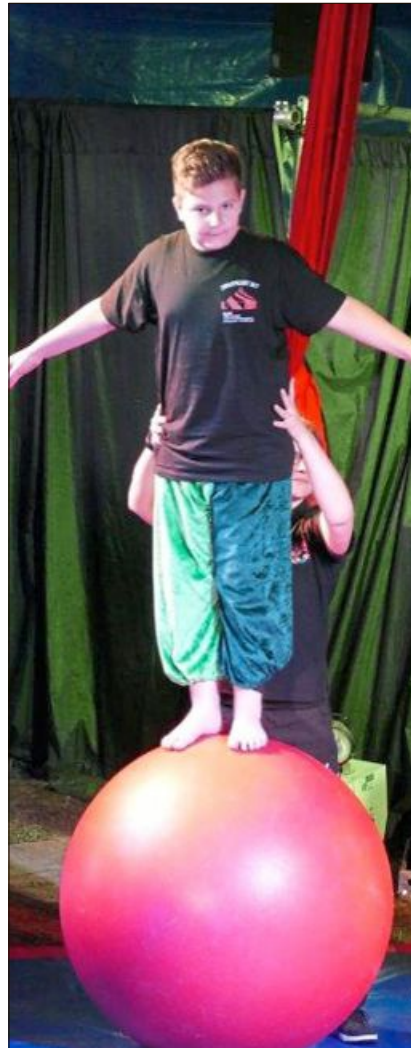
Ballancieren auf der Todeskugel.

Seiltanz und vieles mehr. Der absolute Höhe- und Schlusspunkt waren für die Zuschauer augenscheinlich die akrobatischen und kühnen Vorführungen auf dem Trapez.