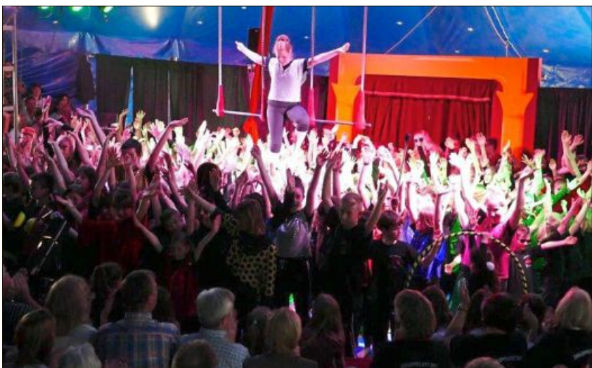
Vollen Einsatz zeigten die Schüler beim Zirkusprojekt.